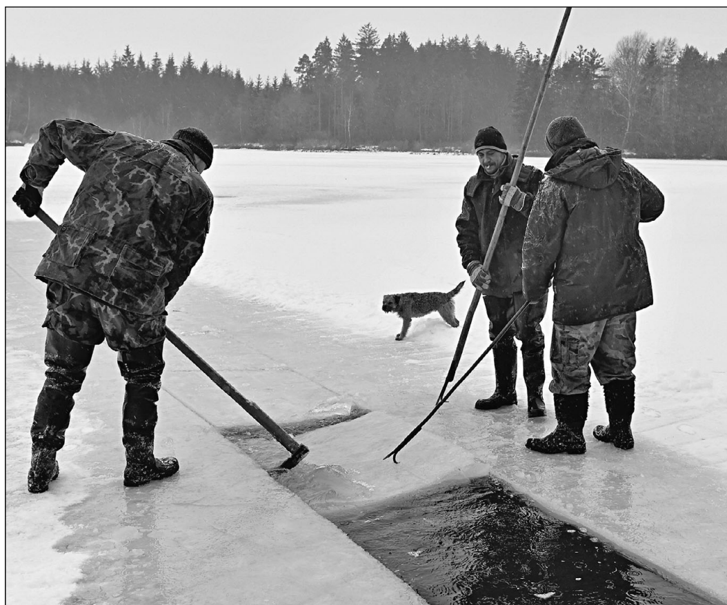
VZDUCH PRO RYBY. Jihočestí rybáři v minulých dnech vysekali na rybníku Dolní velký (na snímku) u Nových Hradů na Českobudějovicku tři prosvětlovací prohlubně. Led prořezávají, když je minimálně 15 centimetrů tlustý. Provzdušňují tím desítky rybníků, ve kterých žijí mladé ryby.